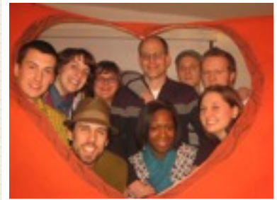
EINSATZ MIT SEMINARISTEN VON "NEUES LEBEN" IN ESPELKAMP