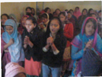
GEMEINDE IN NEPALGUNJ